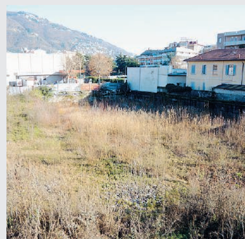
Ai piedi della stazione di Como San Giovanni l'area ex Danzas è stata oggetto di molti progetti sin qui fermi