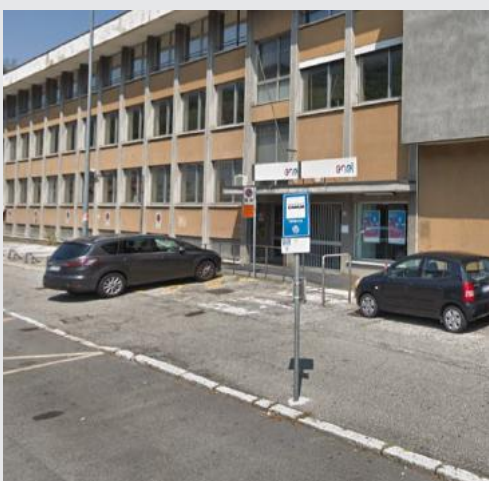
Il comparto oggi occupato dall'Enel è molto meno utilizzato di una volta: potrebbe essere riconvertito