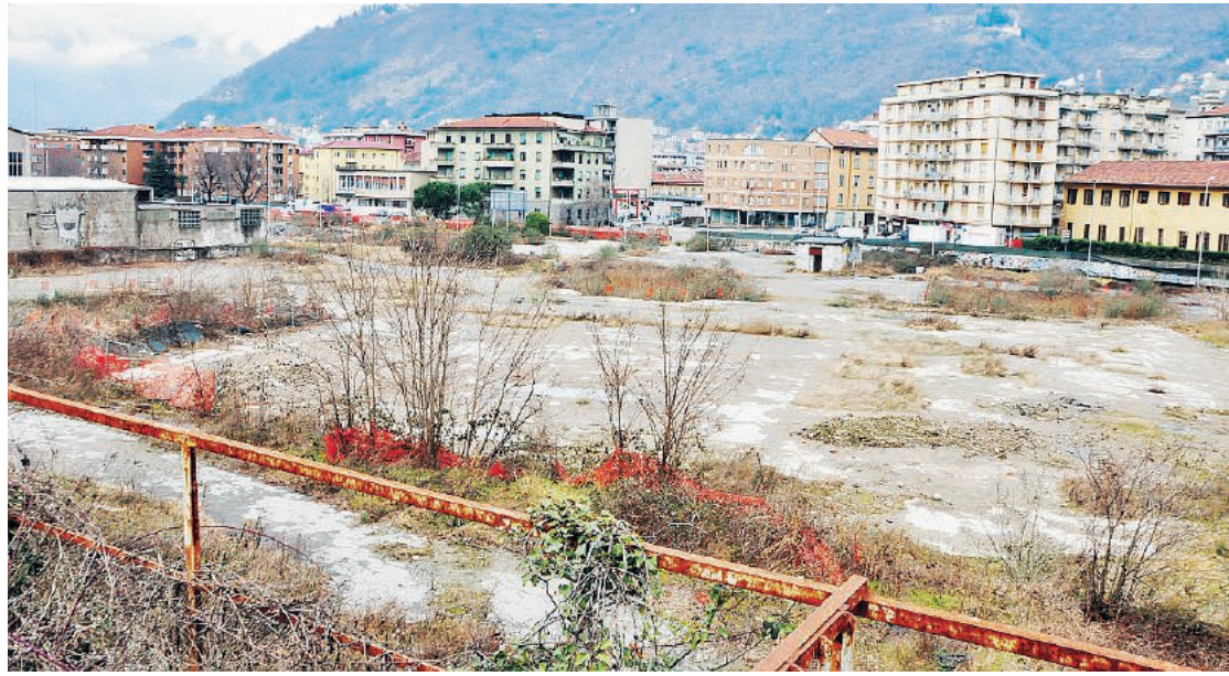
L'area su cui sorgeva la Ticosa non è stata ancora completamente bonificata: il costo finale dell'operazione salirà a 11 milioni di euro