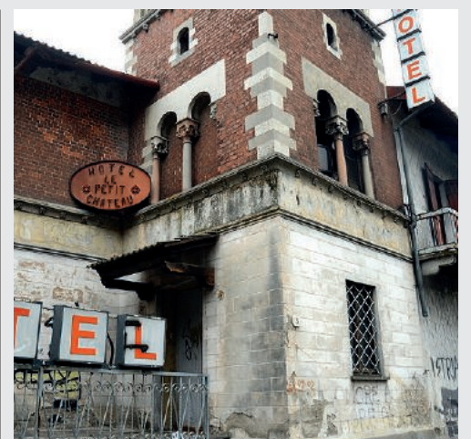
L'ex albergo Petit Chateaux è chiuso ormai da moltissimi anni e in condizioni di evidente degrado