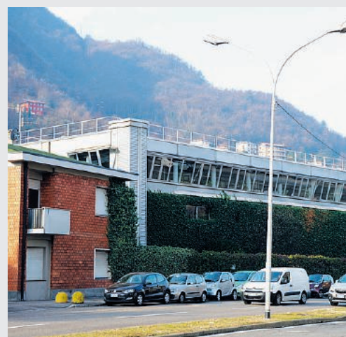
Da anni si parla della necessità di spostare il depuratore cittadino, oggi collocato troppo a ridosso delle abitazioni